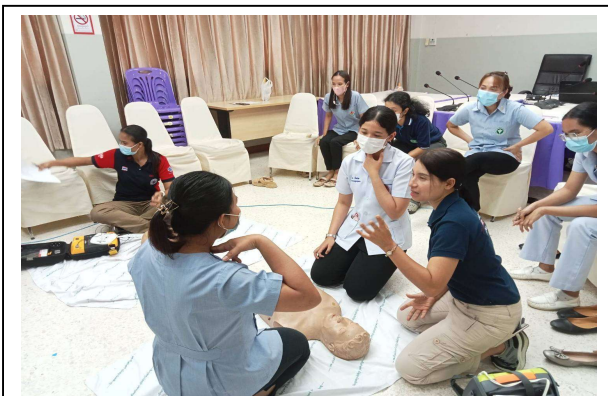
ฝึกปฏิบัติการการปฐมพยาบาล