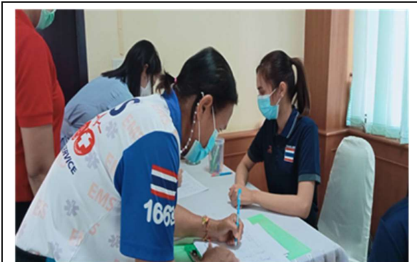
ลงทะเบียน

ณ ห้องประชุมสำนักงานสาธารณสุขอำเภอศรีนครินทร์ จังหวัดพัทลุง