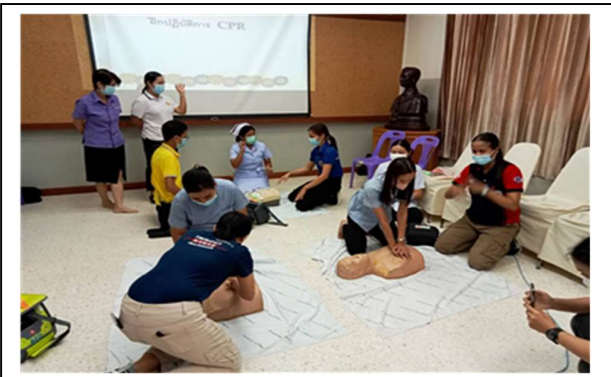
ฝึกปฏิบัติการการปฐมพยาบาล