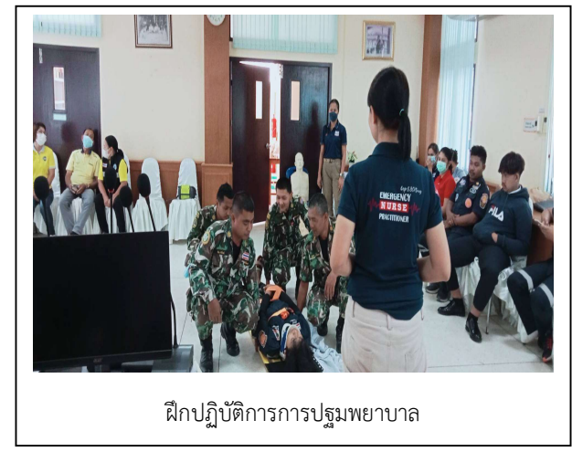
ฝึกปฏิบัติการการปฐมพยาบาล