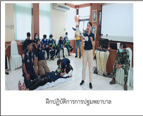
ฝึกปฏิบัติการการปฐมพยาบาล

ณ ห้องประชุมสำนักงานสาธารณสุขอำเภอศรีนครินทร์ จังหวัดพัทลุง