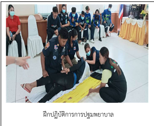
ฝึกปฏิบัติการการปฐมพยาบาล