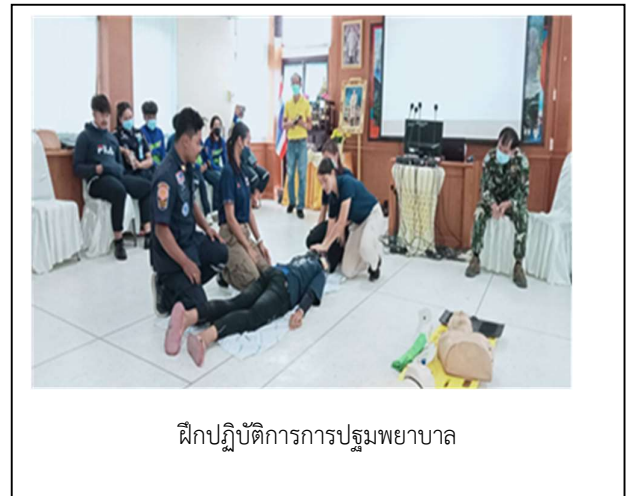
ฝึกปฏิบัติการการปฐมพยาบาล