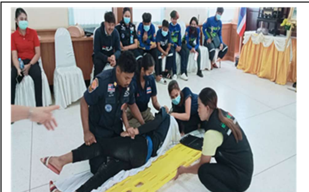
ฝึกปฏิบัติการการปฐมพยาบาล