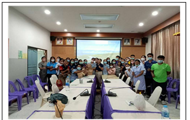
อภิปรายซักถามปัญหา/ปิดการอบรม