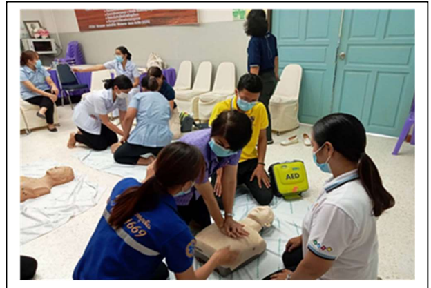
ฝึกปฏิบัติการการปฐมพยาบาล