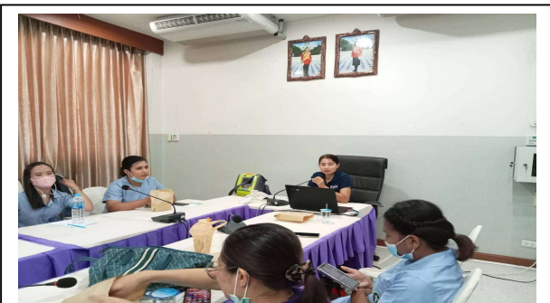
กิจกรรมการประชุมเชิงปฏิบัติการ