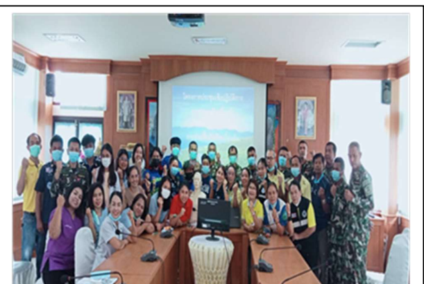
อภิปรายซักถามปัญหา/ปิดการอบรม