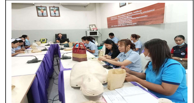
กิจกรรมการประชุมเชิงปฏิบัติการ