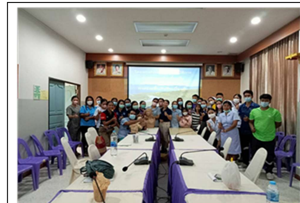
ฝึกปฏิบัติการการปฐมพยาบาล