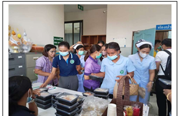
อาหารกลางวัน