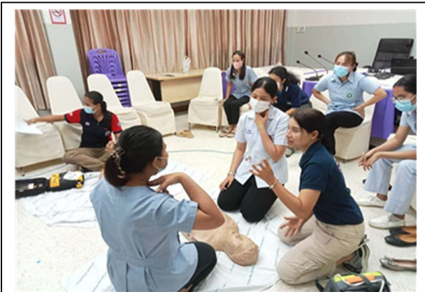
ฝึกปฏิบัติการการปฐมพยาบาล

ณ ห้องประชุมสำนักงานสาธารณสุขอำเภอศรีนครินทร์ จังหวัดพัทลุง