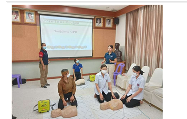
กิจกรรมการประชุมเชิงปฏิบัติการ