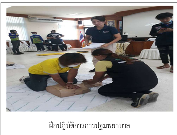
ฝึกปฏิบัติการการปฐมพยาบาล