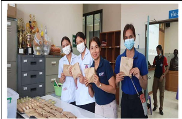
อาหารว่าง

ณ ห้องประชุมสำนักงานสาธารณสุขอำเภอศรีนครินทร์ จังหวัดพัทลุง