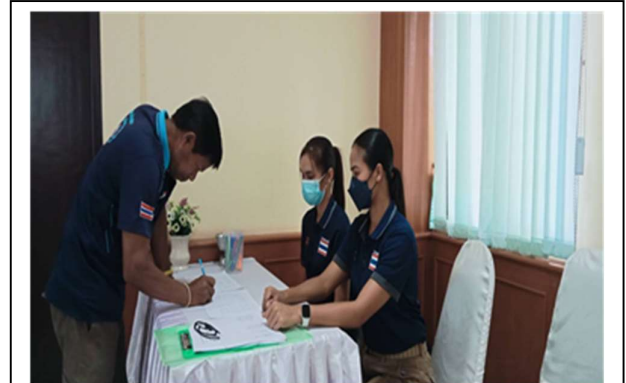
ลงทะเบียน