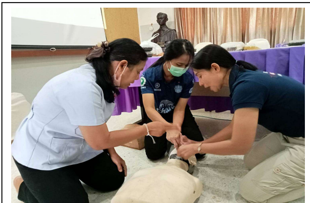
ฝึกปฏิบัติการการปฐมพยาบาล