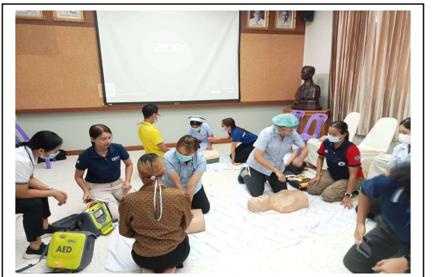
ฝึกปฏิบัติการการปฐมพยาบาล